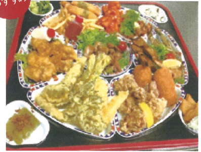
鉢盛 5,000円+税 4~5人前