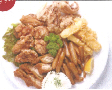
揚物 2,000円+税 2~3人前