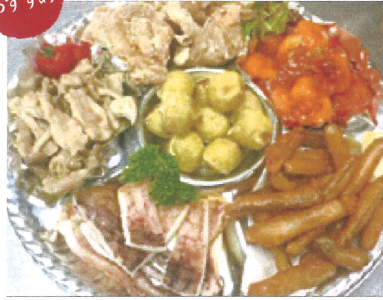
鉢盛 3,500円+税 3~4人前