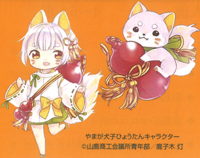
やまが犬子ひょうたんキャラクター ©山鹿商工会議所青年部/鹿子木 灯